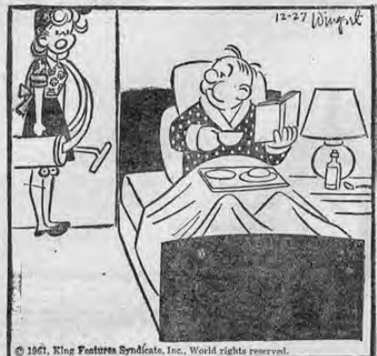
© 1961, King Features Syndicate, Inc., World rights reserved.

¿Quieres estornudar dos veces mirando hacia acá?