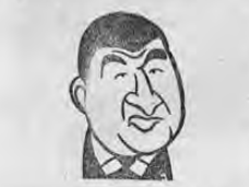
SALINGER.— Anunció que la Casa Blanca repudia el golpe.