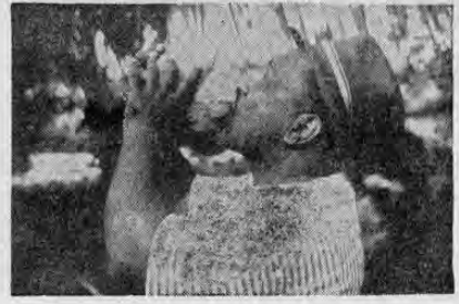
Después de una jornada de duro trabajo, Mr. L. A. Rogers, Ministro de Trabajo de Honduras Británica, aplica su sudor en el agua de un coco, a la sombra de los cocoteros, en Crooked Tree.

Esa partida de dinero, que no se sabe de quienes es, ni la suma que pertenece a cada uno de los cafetaleros, podría ser entregado al Invu como adelanto a subvenciones para los planes elaborados. Es de esperar que la moción presentada por el señor Solano Orlich tenga acogida entre toda la diputación dando el fin sobre lo que persigue el INVU.