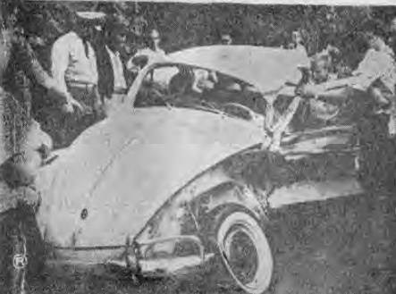
COMPLETAMENTE DESPEDAZADO quedó el pequeño automóvil que conducía el señor Castro, quien fue ingresado de emergencia en el Hospital Central del Seguro Social, el centro de auxilios médicos que se encontraba más cercano. Las autoridades hicieron una investigación para establecer las responsabilidades.

en el sitio mortalmente herida y aunque se la condujo al acto al Hospital Maj Peralta, falleció minutos después. Las autoridades judiciales fueron enteradas por la Comandancia de Plaza acerca de lo ocurrido, iniciándose la tramitación sumarial. No fueron suministrados portemortes acerca de cómo se produjo este trágico suceso.